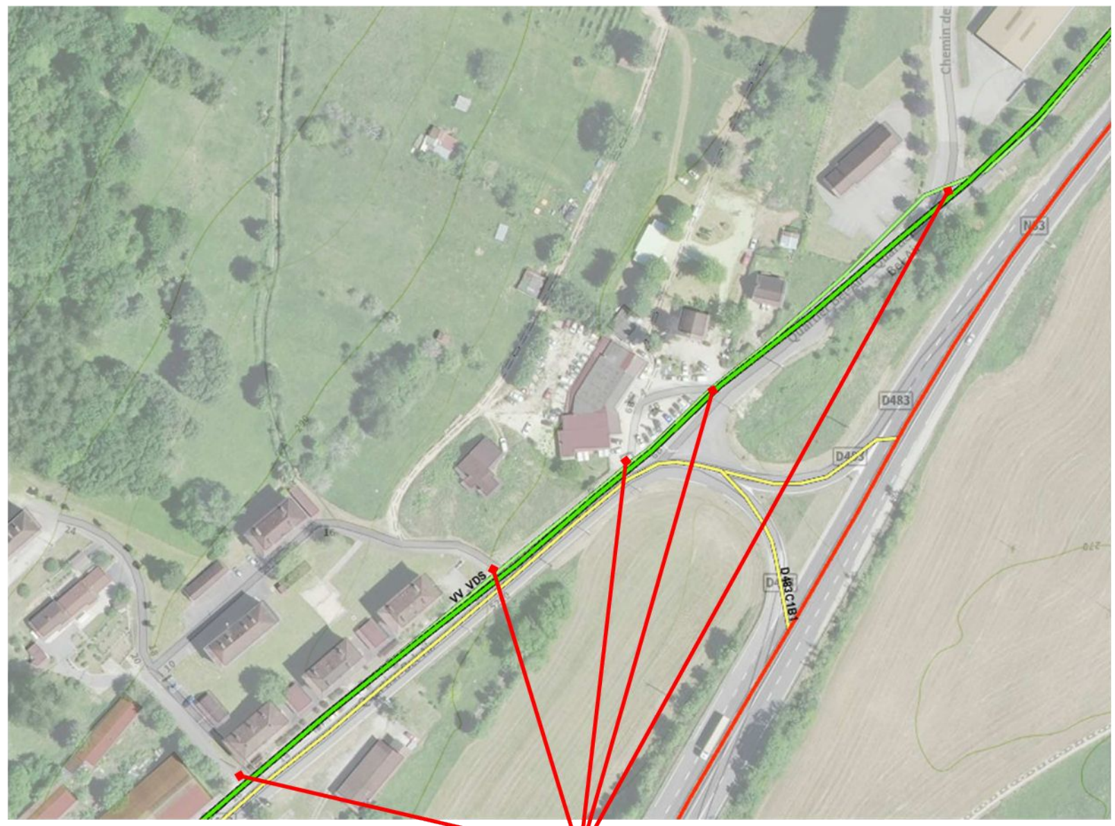
Commune de Port-Lesney